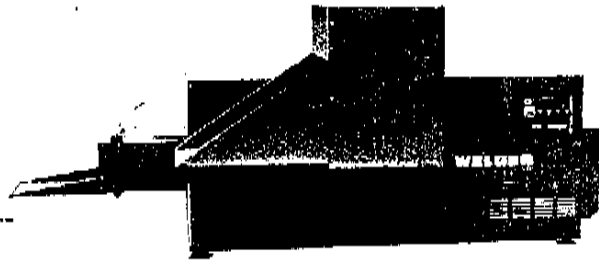
Ausführung B: Einfülltrichter mit Heckaufgabetisch