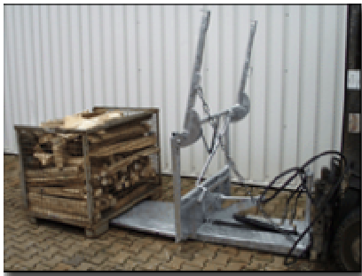
Aufnahme der Gitterbox