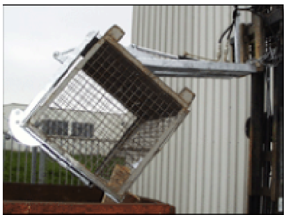
Abkippen der Gitterbox

Ein unentbehrlichen Helfer beim Transportieren, Abkippen und Reinigen von Euro-Gitterboxen nach DIN 15155